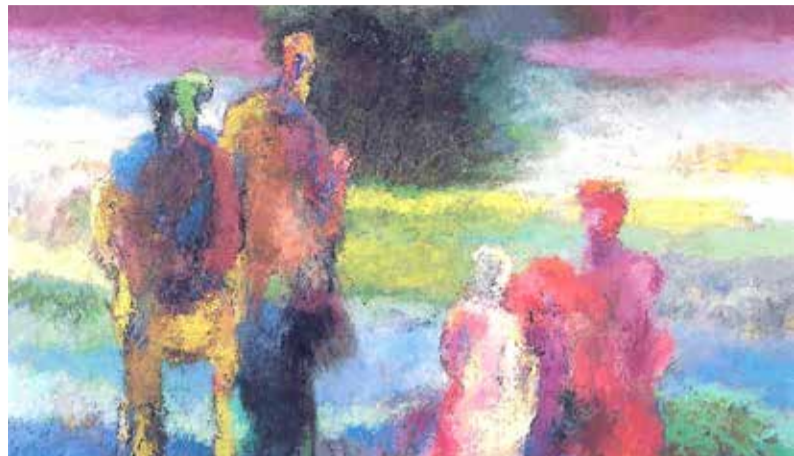
Leo Schatz, 'Het gezelschap', 1995, Collectie Joods Historisch Museum

VERDIEPING • Naar een Top2000-kerkdienst in Zoetermeer Noord? Nee, dat is voor jongeren ... Naar het Inloophuis Rokkeveen? Nee hoor, daar komen alleen vrouwen ... Wie in de kerk activiteiten, leerhuizen of speciale vieringen organiseert, krijgt dit soort opmerkingen wel eens te horen. En die zijn maar heel soms terecht.