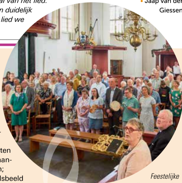
Feestelijke dienst op zondag 3 juni in de Oude Kerk.