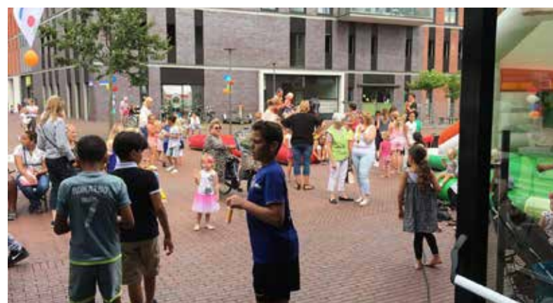
Zomerse Heempret bij Perron aan het Oosterheemplein.